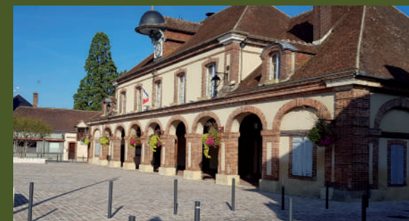
▲ Mairie de La Ferté-Vidame