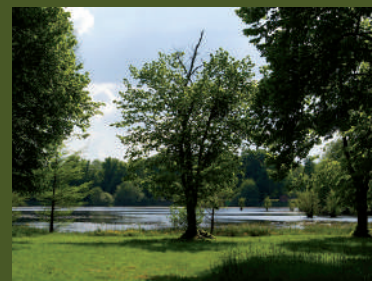
▲ Plan d'eau du Miroir