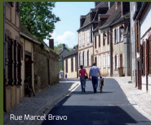
Rue Marcel Bravo