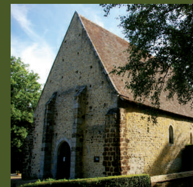
▲ La Chapelle de Réveillon