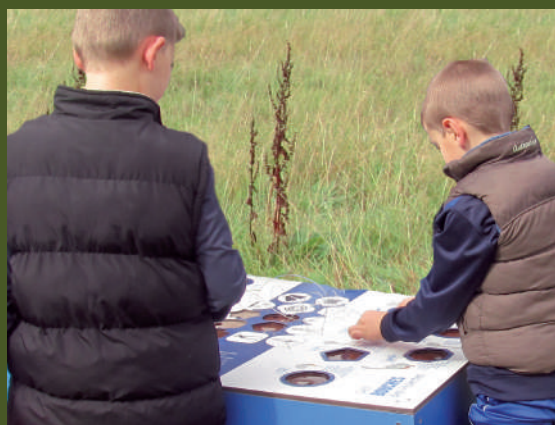
▲ Sentier d'interprétation